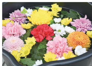
※写真は昨年のもになります。