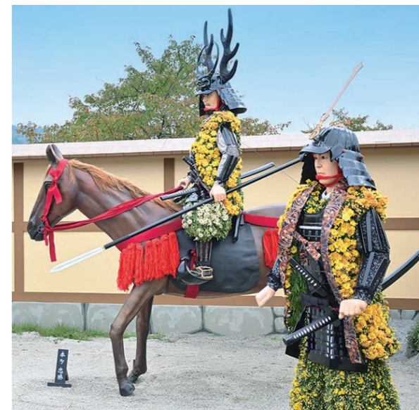
※写真は昨年のもになります。